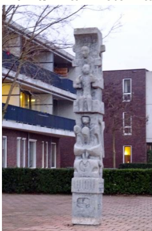
Stichting De Grijpvogel/ september 2019

'De Zuil' van Pieter van Velzen doet het meest aan een totempaal denken. Alleen is deze vierkant en een totempaal rond. Hij heeft dan ook niet voor niets de naam 'De Zuil' gekregen. Oorspronkelijk stond het beeld voor het gebouw 'In de Luwte', vanaf 1975 een dagverblijf voor gehandicapten en daarvoor de BLO van meester Blokland. Pieter van Velzen werd door de architect van 'In de Luwte' naar Oosterwolde gehaald. In 1978 werd het beeld geplaatst. Het heeft een archaische en symbolische betekenis. Dat is het enige wat we weten. In ieder geval is een totempaal in essentie een embleem van een familie of clan. In 'In de Luwte' zaten ook mensen die met elkaar een bepaalde band hadden. Je kunt dus in de zuil verschillende motieven herkennen. Pieter van Velzen had voor elk motief zijn eigen verhaal. Misschien komt daar ooit nog eens iets van boven water.