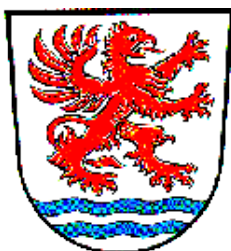
Neuhaus am Inn (Zuid Dld)