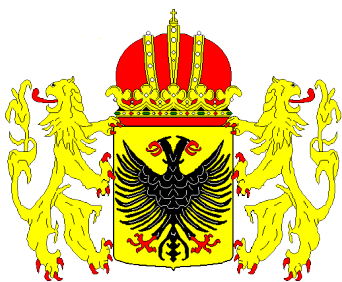
Wapen van Bolsward

In de heraldiek duidt 'omziend' op een breuk met het verleden. Wellicht heeft men daarmee het verschil tussen de twee grietenijen Stellingwerf-Oosteinde en Stellingwerf-Westeinde beter willen aangeven. Op een afbeelding uit de 18 e eeuw (1739) op een kaart van Johan Vegelin van Claerbergen zien we beide griffioenen nog tegenover elkaar in spiegelbeeld weergegeven, zoals dat eerder o.a. ook al op kaarten van Schotanus het geval was. Tekeningen van de Hoge Raad van Adel uit 1818 met van elkaar verschillende griffioenen geven inmiddels het onderscheid aan tussen de beide grietenijen; die van Stellingwerf Westeinde met een omziende griffioen. Bij de gemeentewet van 1851 werd de benaming 'grietenij' vervangen door 'gemeente' en 'grietman' door 'burgemeester', zodat in heel Nederland dezelfde naamgeving werd gebruikt. Jhr. Georg Wolfgang Franciscus Lycklama à Nijeholt werd in 1851 aansluitend de eerste burgemeester van Ooststellingwerf. Maar voorafgaand aan 'deze breuk met het verleden' zou er dus nog een andere geweest moeten zijn, die aanleiding was tot het doen 'omzien' van de griffioen in het wapen van Stellingwerf-Westeinde.