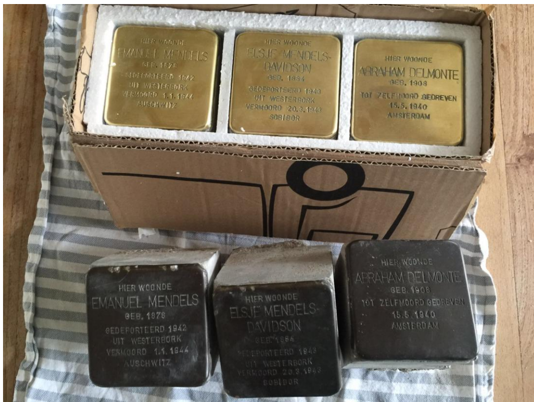
De nieuwe en de oorspronkelijke Stolpersteine