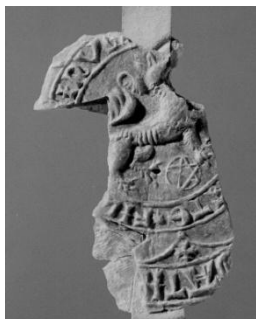
1350 Oude zegel

Zie de oude zegels en andere afbeeldingen, zoals o.a. bij Winsemius en Schotanus: