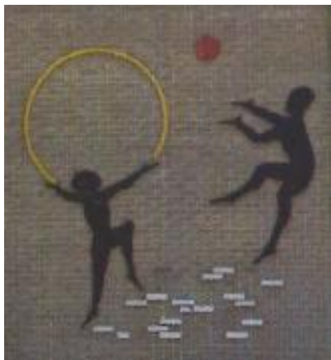
Aan de schoolmuur