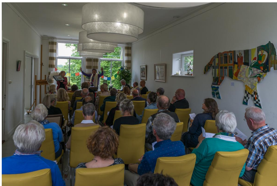
Een volle bovenzaal met bidders bij Lunia