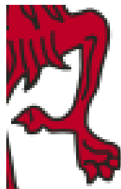
Gevelsteen oude gemeentehuis Huidige gemeentewapen