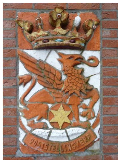
groene robijn (ruit) – rode smaragd (ovaal) Oosterwolde Laco