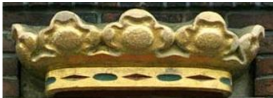
Gevelsteen oude gemeentehuis