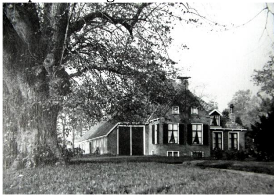
De Bult-boerderij in 1956

Respectvol omgaan met het cultuurhistorische verleden van een locatie is