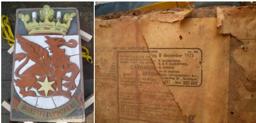
De uitgenomen gevelsteen uit 1973