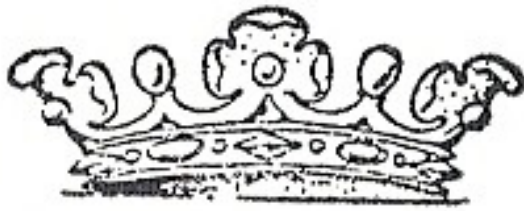
Standaardkroon = Dorpengemeentekroon?