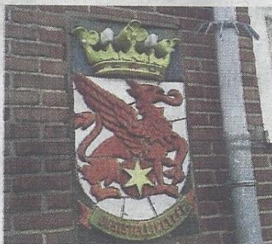
Deze gevelsteen krijgt een plekje in de muur van het nieuwe multifunctioneel centrum.

De kosten voor de reddingsoperatie liggen rond de €4000. Om de financiering rond te krijgen vroeg Wuijts om subsidie bij diverse fondsen, waaronder het Bercoopfonds en Rabo coöperatiefonds.