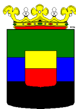
II – 1964