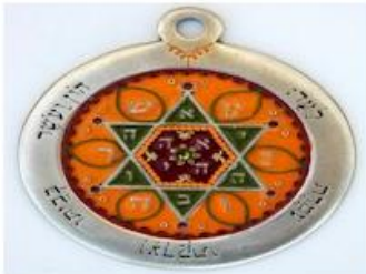
Zegel van Salomon