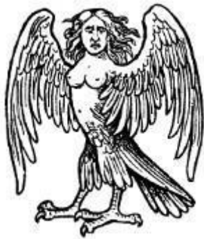
A Harpy, wings disclosed.

Vrouwelijke windgeesten, meestal roofvogels met enorme klauwen en het hoofd van een mooie vrouw. Ze staan voor de onderwereld maar konden ook stormen op zee opwekken. Er zijn drie harpijen, Aello, Kaleino en Okypete.