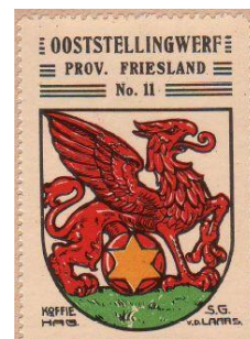
Wapen in Koffie Hag albums +/- 1930