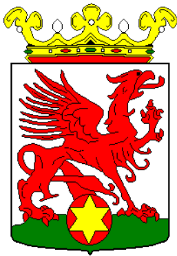
Hoge Raad van Adel 1818