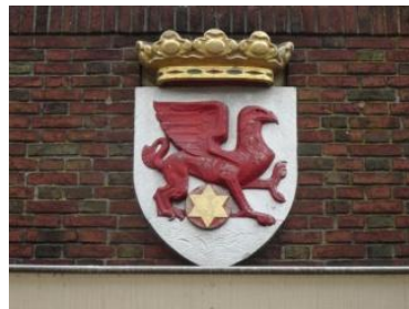
Oude stadhuis Oosterwolde