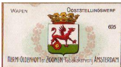
Het wapen in de Oldenkott albums +/- 1910