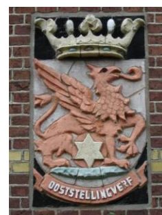
Oude school Nijeberkoop